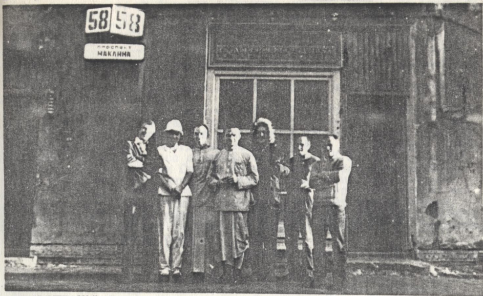
"САНКИРТАНА" приглашает в гости