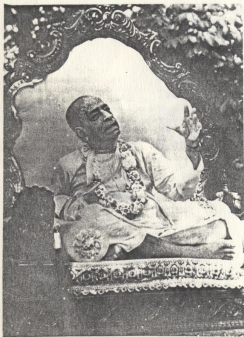
His Divine Grace A.C. Bhaktivedanta Swami Prabhupada Founder, International Society for Krishna Consciousness

Решение проблемы повторяющихся рождений и смертей - в сознании Кришны, которое мы практикуем и предлагаем каждому. Совершенный результат такой практики заключается в том, что после того как нынешнее тело станет бесполезным и умрет, человеку не придётся больше принимать материальное тело, которое должно рождаться, умирать, болеть и стареть. Такова истинная наука.